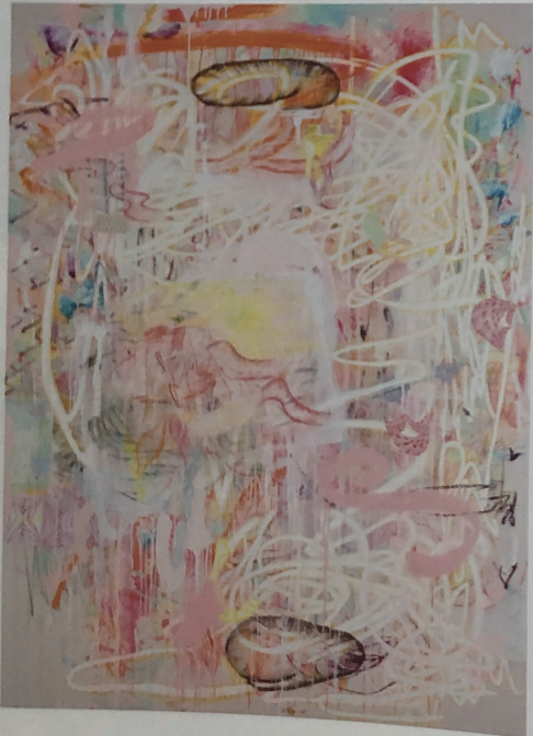
정윤경, 'FS-two spot', Mixed media on unprimed canvas, 150x190cm, 2022

올해 키아프 서울에서 어떤 작품을 선보이나? '핑거 스펠' 시리즈를 전시한다. 영국에서 지낼 때 코로나 19로 인해 작업실에 가지 못해 집에서 휴대폰 화면에 그림을 그린 것이 '핑거 스펠' 시리즈의 시작이었다. 이후 한국으로 돌아와 보다 나아진 상황에서 시리즈를 발전시켰다. 아크릴물감과 오일 스틱 등 다양한 재료를 활용하고, 드로잉뿐 아니라 종이 콜라주도 시도하는 식으로 말이다. 우리는 휴대폰 화면 속 SNS를 살펴보면 손가락 하나로 감정을 쉽게 표현하고, 무언가를 함부로 평가하기도 하지 않나. 우울한 감정도 대담하고 밝은 선으로 표현할 수 있다고 느꼈다. 휴대폰 화면 위로 손가락을 움직이며 주문을 걸 듯이, 하루하루의 감정을 담아 선을 그려내며 작품을 완성한다.